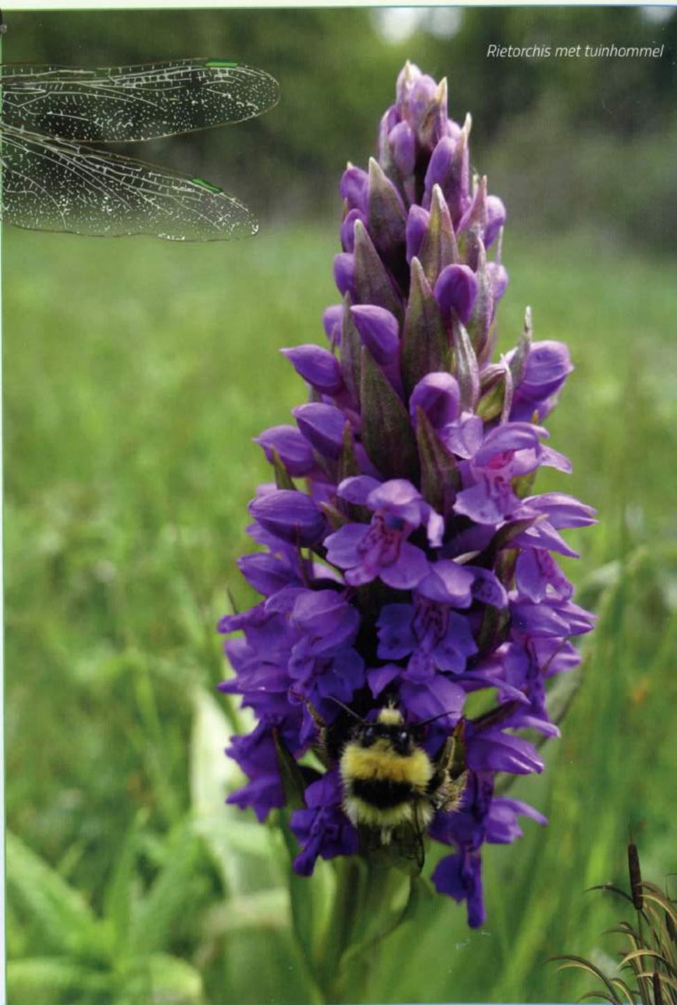
Rietorchis met tuinhommel