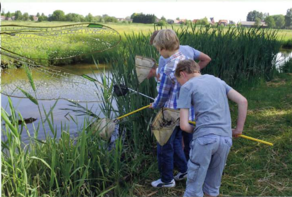
Dat kinderen van nu en morgen mogen genieten van schoon water