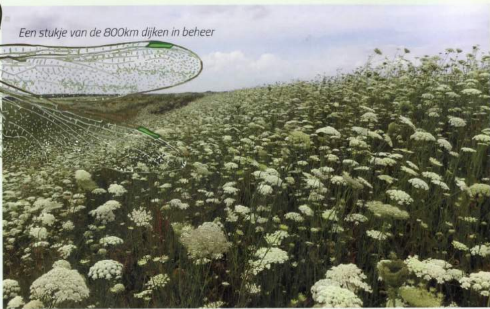
Een stukje van de 800km dijken in beheer