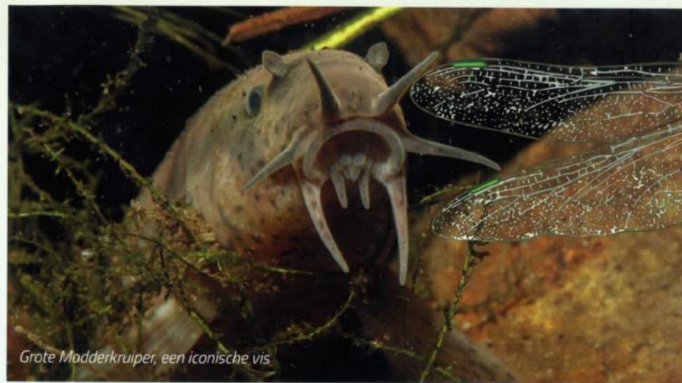
Grote Modderkruiper, een iconische vis

Het waterschap Hollandse Delta heeft grote invloed op biodiversiteit buiten de natuurterreinen. Zij beheert 800 km dijken, 1300 km wegen en 300 km fietspaden met bermen, 7000 km watergangen met oevers en daarnaast nog een groot aantal terreinen bij zuiveringen en werkplaatsen. Bij elkaar een enorme oppervlakte aan water en groen waar veel natuur- en recreatiewinst te boeken is. Water Natuurlijk wil dat het beheer van dit water en groen ook gericht wordt op biodiversiteit en waterrecreatie. Dat kan heel goed in combinatie met waterveiligheid, waterkwaliteit, waterbeheer en verkeersveiligheid. Vaak versterken die zaken elkaar juist.